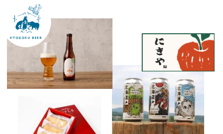
〈上から京極麦酒、NIKIYA FARM BREWERY、余市産リンゴのケーキ〉