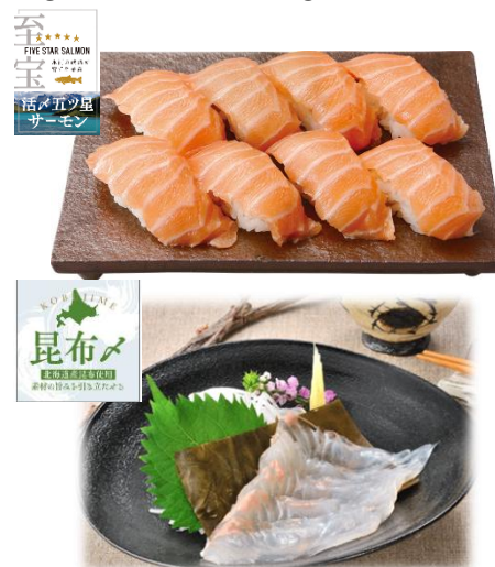
〈㊤至宝5ツ星㊦昆布締め商品〉