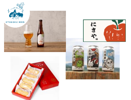
〈上から京極麦酒、NIKIYA FARM BREWERY、余市産リンゴのケーキ〉