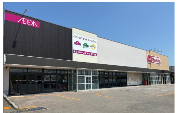
マックスバリュ共和店外観