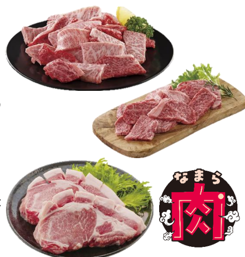
〈㊤2つ：国産黒毛和牛、㊦ポークステーキ〉