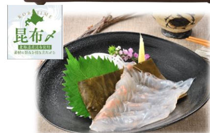
〈㊤至宝5ツ星㊦昆布締め商品〉