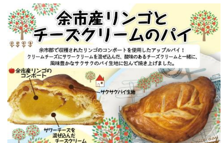
〈④手伸ばしピザ、 ⑤余市産リンゴとチーズクリームのパイ〉