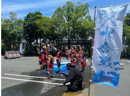
水合戦（浜松志都呂）