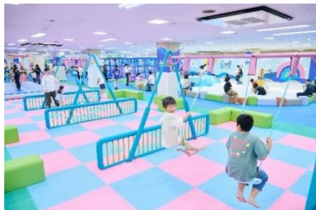
のびっこジャンボ（イオン和泉府中）