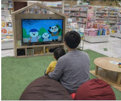
みらいやの森／（未来屋書店名取店キッズスペース）

未来屋書店では、地域の子どもたちが本を通じて世界をひろげ、豊かな心を育むお手伝いをするための児童書コーナー「みらいやの森※7」を順次導入しています。親子でくつろげるスペースでは、読書や読み聞かせの動画を楽しむことができます。本に囲まれた空間で、快適なひと時をお過ごしください。