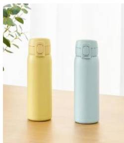
<パッキン一体型スクリューマグボトル>