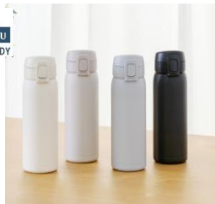
<ワンタッチマグボトル>