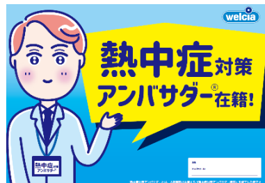
イオンのクールスポット ウエルシア店舗内のクーリングシェルター