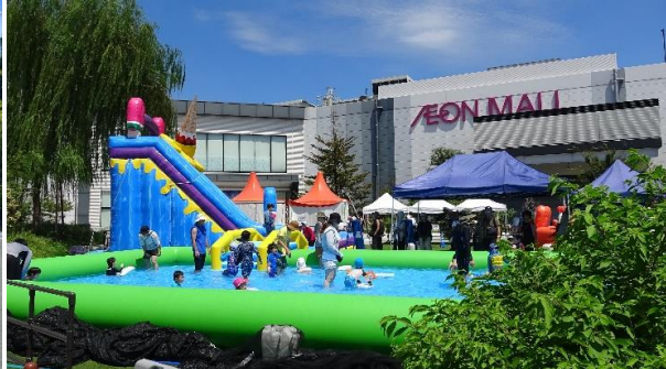
AGEO Water Park（上尾）