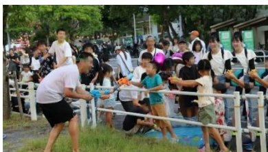
ツルマイ・チクサ ミズマツリ

全国の各ショッピングセンター（以下、SC）では、ご家族で夏の思い出作りができる「こども縁日」を館内で計画しているほか、イオンタウン千種では名古屋工業大学等と連携した地域一体型イベント「ツルマイ・チクサ ミズマツリ」を実施し、都市部での涼しい回遊空間を創出しています。また、各SCで自治体指定の「クーリングシェルター」として開放する取り組みを強化しており、2025年8月現在で全国23のSCが指定を受けています。館内では「熱中症対策アンバサダー®」の講座を修了した従業員がお客さまの安全を守る具体的な対策を呼びかけるなど、安全で快適な環境を提供してまいります。