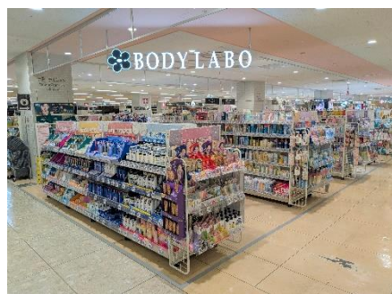
ビューティケア用品売場