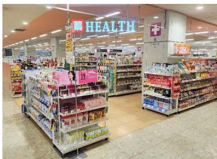
ヘルスケア用品売場