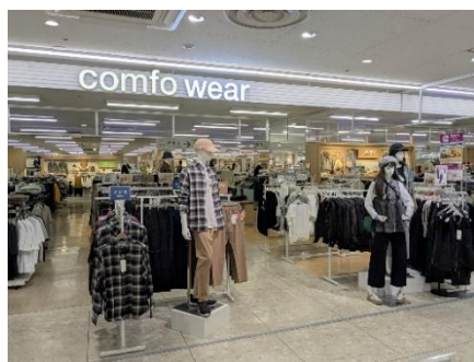
comfo wear (カジュアル、タウンカジュアル テイスト商品の売場)

婦人服・紳士服の売場は、普段使いで着られるカジュアルテイストの売場、スポーツやビジネス、フォーマルなどのオケーションの売場、M Z世代に合わせた売場などライフステージを基軸とし、シーン別・年齢別に分類した売場構成へ変更しました。