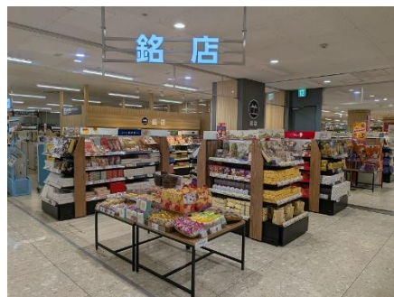
贈答用のお菓子などを集めた銘店