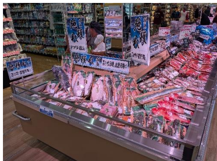
水産売場（苫小牧で水揚げされた魚介類）