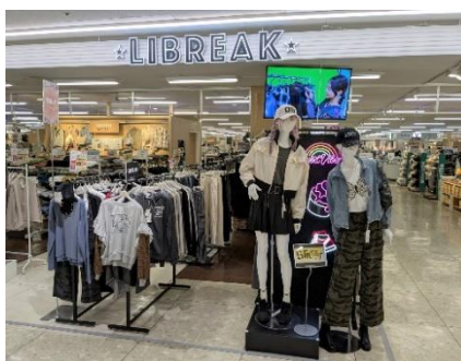
LIBREAK (M Z世代をターゲットとした売場)