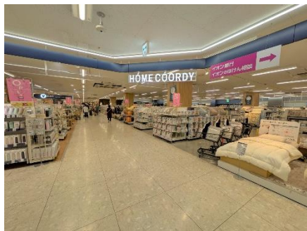
ホームファッション売場 (ホームコーディ)

ホームファッションの売場では、トップバリュのホームファッションシリーズ「ホームコーディ」を中心に扱う売場を新たに構築。寝具や家具、生活雑貨など、暮らしをもっと楽しく快適に、ちょっとおしゃれで便利な商品をお手頃価格で多数取り扱いしています。また、ヘルスケア・ビューティケア用品の売場はこれまでの約1.5倍に拡大し、インバウンド需要にお応えする商品も多数品揃えします。