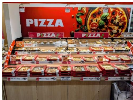
デリカ売場（手伸ばしピザ）