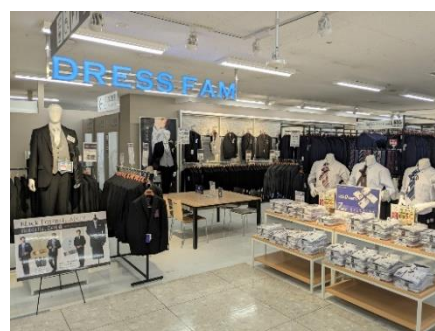
DRESS FAM (ビジネスカジュアルとフォーマルを 軸とした売場)