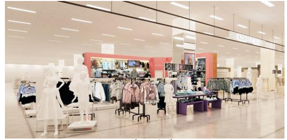
〈キッズリパブリック〉

文具やゲームなどを取り扱う売場を1階から2階衣料品売場に移設し、子供衣料品やトイ・ホビー、アミューズメント施設などと合わせ、お買物から遊びまで時間を忘れて楽しめるゾーン「キッズリパブリック」を新たに構築します。