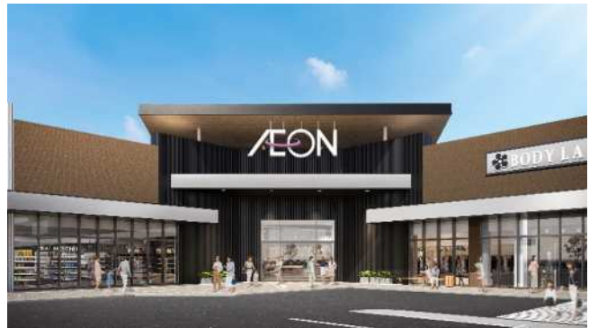
※画像はイメージです。変更となる場合があります。