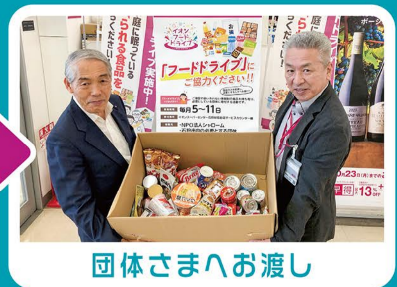
団体さまへお渡し