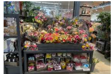
【フラワー&ガーデン売場】