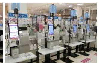
【キャッシュレスセルフレジ】