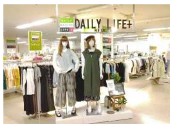
【DAILY NEW EXCITING LIFE +】

「毎日来てもらえる、新しく楽しい地域1番店」をテーマに、「DAILY NEW EXCITING LIFE + (デイリー ニュー エキサイティング ライフ プラス)」と銘打った売場を構築します。「DAILY NEW EXCITING LIFE +」は、普段着やインナーといった実用衣料をお値打ち価格でご提供するとともに、おしゃれ着や機能性素材の衣料品などを品揃えする新しい形態の売場で、当社において当店が初めての取り組みとなります。靴売場は、洋服とコーディネートしながらお選びいただけるよう、既存の1階売場から2階に移設します。