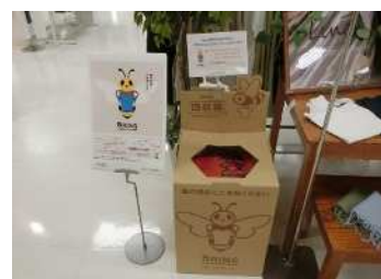
【衣料品回収ボックス】