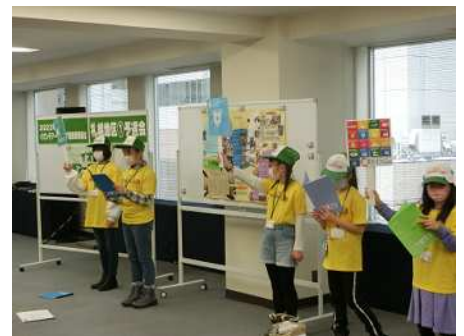
1年間の活動の成果を発表する 「壁新聞発表会」の様子

イオン チアーズクラブとは、小学1年生から中学3年生までの子どもたちが、店舗周辺を活動拠点とし、様々な環境・社会問題に取り組み、みんなで考えることを目的とするクラブです。公益財団法人イオンワンパーセントクラブの支援を受け、イオン各店舗の従業員のサポートのもと、リサイクル工場・動物園といった施設見学や農業体験などさまざまな活動に取り組んでいます。北海道のイオン チアーズクラブメンバーは約240名、メンバーをサポートするコーディネーター(当社従業員)は約240名で運営しています。当店にもイオンチアーズクラブ 紋別がございます。