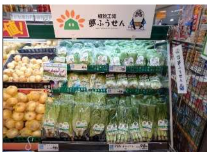
【紋別ベジタブルファクトリーで栽培された葉物野菜】

冷凍食品の需要が高まっている中、お弁当用冷凍食品はもとより、野菜、果実やデザートなどの冷凍商品を豊富に品揃えするため延べ尺数を約4倍に拡大します。また、水産や畜産の売場においても冷凍ケースを新たに導入し、冷凍素材の品目を充実させます。