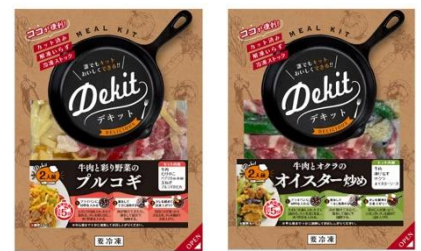
〈冷凍ミールキット〉