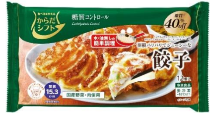
〈「からだシフト」商品の一例〉