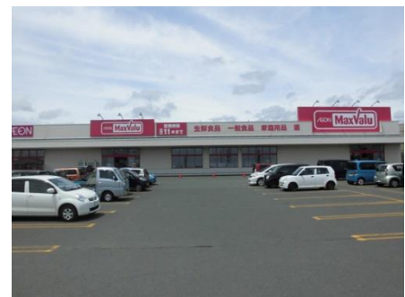
〈マックスバリュ登別店 外観〉