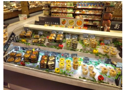
〈ディッシュプラス〉