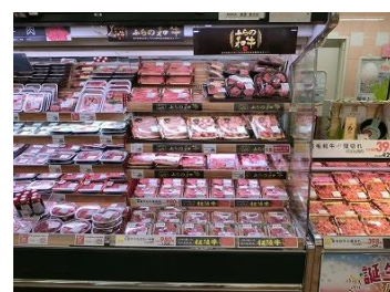
【銘柄和牛のコーナー】