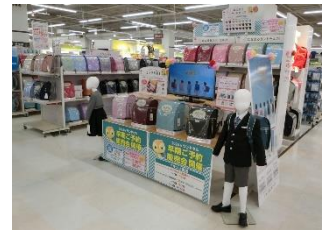
【地域最大級のランドセル売場】

※7月7日（金）～7月30日（日）、8月4日（金）～8月27日（日）の期間も実施予定です。