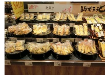
【天ぷらのコーナー】