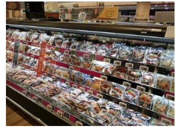
【チルドレディミール】