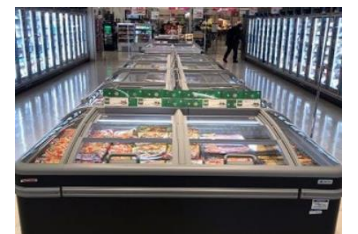
【ノンフロン冷ケース】