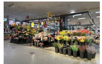
【フラワー&ガーデン】