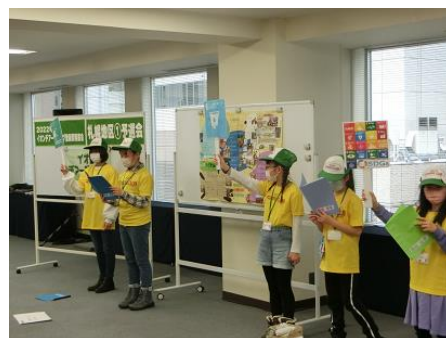
1年間の活動の成果を発表する 「壁新聞発表会」の様子

イオン チアーズクラブとは、小学1年生から中学3年生までの子どもたちが、店舗周辺を活動拠点とし、様々な環境・社会問題に取り組み、みんなで考えることを目的とするクラブです。公益財団法人イオンワンパーセントクラブの支援を受け、イオン各店舗の従業員のサポートのもと、リサイクル工場・動物園といった施設見学や農業体験などさまざまな活動に取り組んでいます。北海道のイオン チアーズクラブメンバーは約240名、メンバーをサポートするコーディネーター(当社従業員)は約240名で運営しています。当店にもイオン チアーズクラブ上磯がございます。