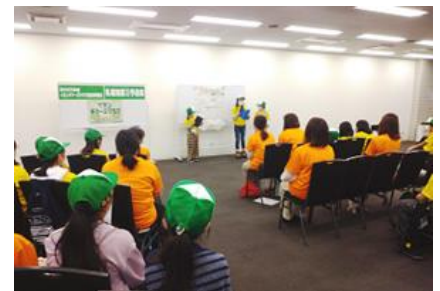
1年間のチアーズの活動を壁新聞の形で発表する「壁新聞発表会」

また、近隣の子供たちを対象にイオン チアーズクラブへの参加メンバーを募集し、環境に関する教育を進めています。イオン チアーズクラブとは、子供の健全な育成を目的に、店舗の周辺でエコ活動を行うことで環境に興味を持ち考える力を育てる活動です。当モールでは、15名のメンバーとともにこの活動の輪を広げています。