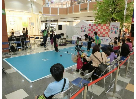
「イオン de パラスポ」

そのほか、昨年5月にはご来店される多くのお客さまに、パラスポーツの体験や交流イベントを通し、多様な方々が相互に支え合う心のバリアフリーへの理解を深めていただくことを目的に、「イオン de パラスポ」を道内初開催し、多くのお客さまにご参加いただきました。今年2月には、北海道が主催する「みんなおいでよ！北海道ジオパーク展2023」を開催し、イベントでは、ジオパークを紹介するパネル展や体験イベント、各ジオパークの概要や取り組みについて紹介するステージイベントなどが実施しました。