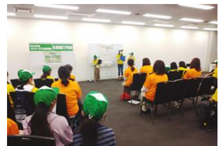
1年間のチアーズの活動を壁新聞の形で発表する「壁新聞発表会」

また、近隣の子供たちを対象にイオン チアーズクラブへの参加メンバーを募集し、環境に関する教育を進めています。イオン チアーズクラブとは、子供の健全な育成を目的に、店舗の周辺でエコ活動を行うことで環境に興味を持ち考える力を育てる活動です。当モールでは、15名のメンバーとともにこの活動の輪を広げています。