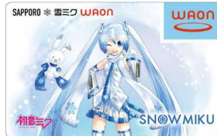
Illustration by KEI © Crypton Future Media, INC. www.piapro.net piapro