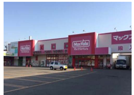
〈マックスバリュ新琴似店 外観〉