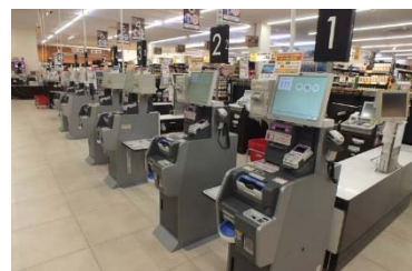
〈お支払いセルフレジ〉