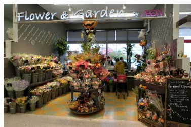
〈フラワー&ガーデン〉