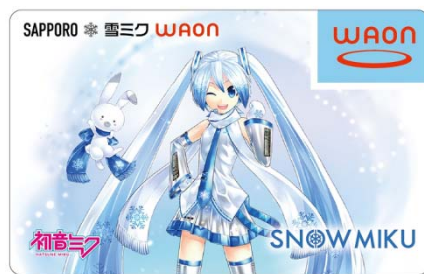
Illustration by KEI © Crypton Future Media, INC. www.piapro.net piapro