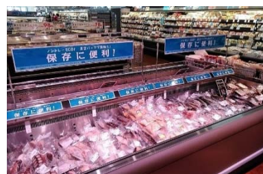
〈フローズンフィッシュのコーナー〉