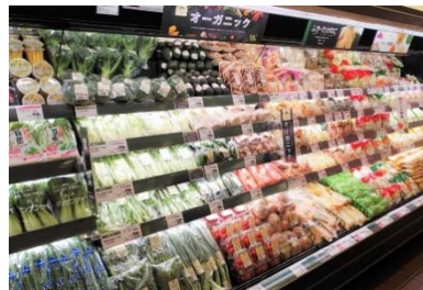
〈オーガニック野菜のコーナー〉