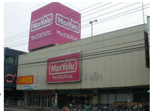
〈マックスバリュ澄川店 外観〉