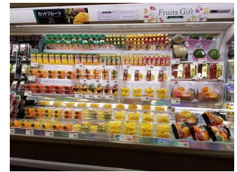
〈カットフルーツのコーナー〉