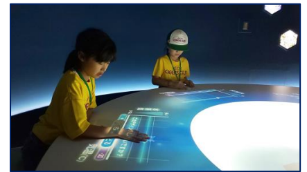
〈青少年科学館での活動の様子〉

マックスバリュ澄川店の店頭でも最寄りの藻岩イオン チアーズクラブのメンバー募集を行っています。