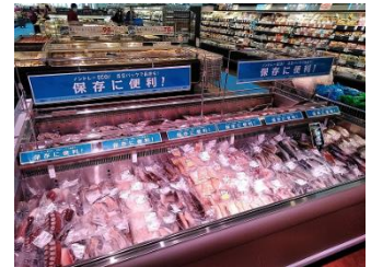
〈フローズンフィッシュのコーナー〉