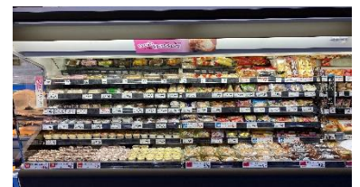
〈スイーツのコーナー〉