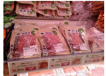
〈畜産ノントレー包装商品〉