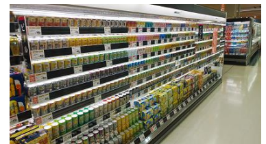
〈缶酎ハイのコーナー〉