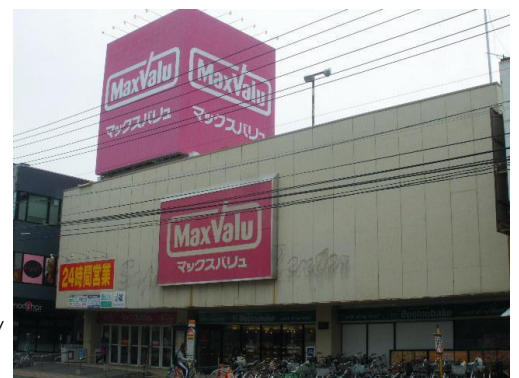
〈マックスバリュ澄川店 外観〉