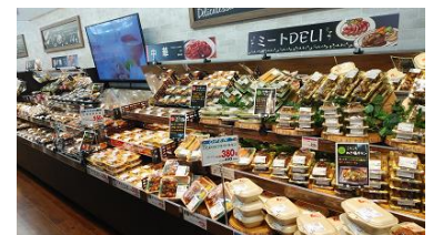
〈お惣菜のコーナー〉