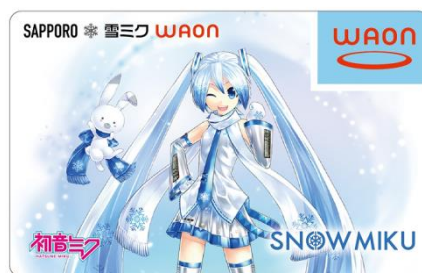
Illustration by KEI © Crypton Future Media, INC. www.piapro.net piapro