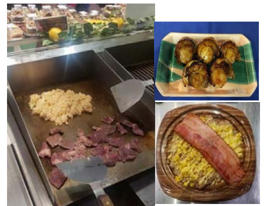
高温調理で焼き上げる鉄板焼き