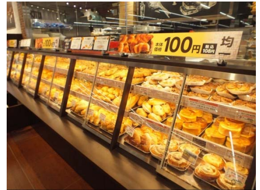
本体価格100円均一売場