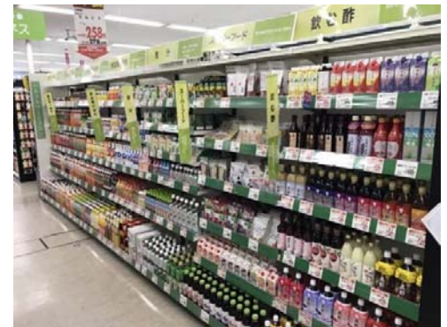
青汁、飲む酢コーナー化