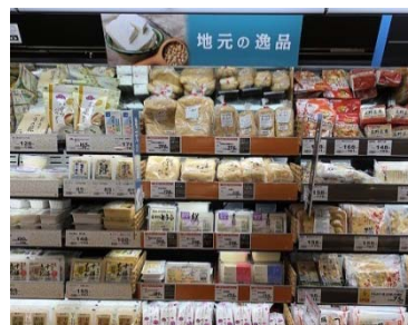
地元のお豆腐や揚げ