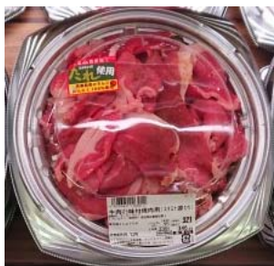
スタミナ源たれ味付け牛