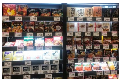
レトルトカレーコーナー