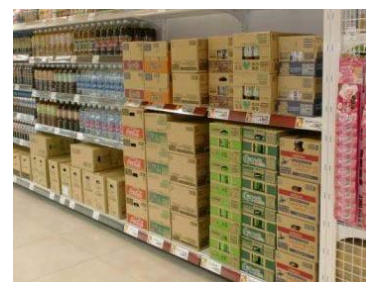
飲料のケース販売