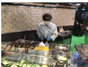
キッチン内の鉄板で調理をする様子