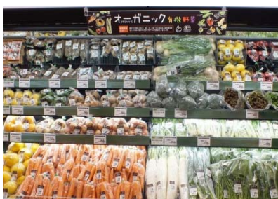
オーガニック野菜