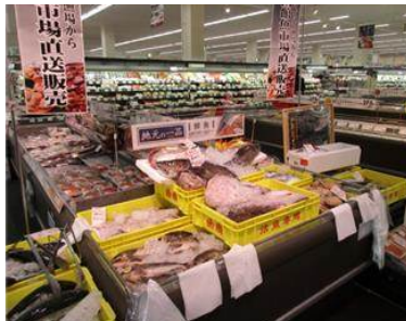
函館市場直送の鮮魚