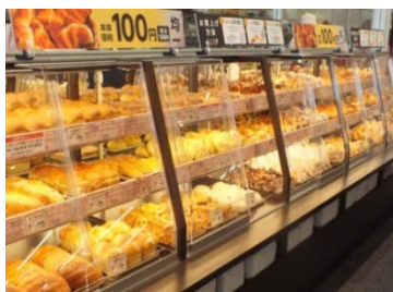
パンの 100 円均一コーナー