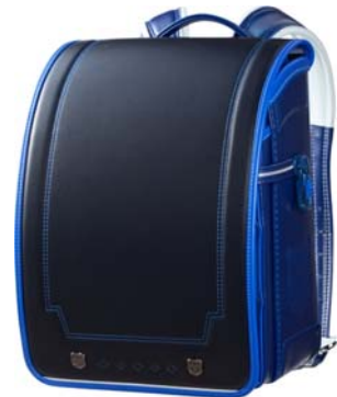
エンブレムデザインの一例