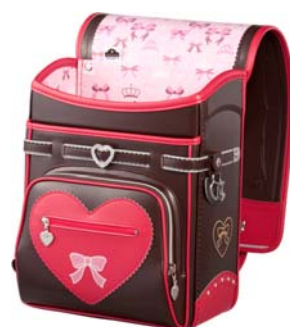
ブラウン×ストロベリー