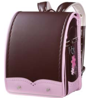
(ハート&花びらデザイン) ブラウン×ベビーピンク