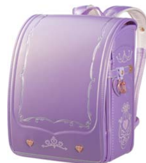
メタリックラベンダー