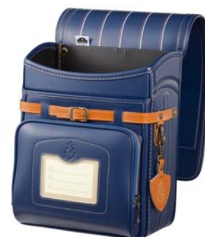
カラー：マリンブルー