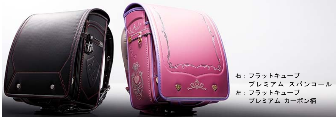
右：フラットキューブ プレミアム スパソール 左：フラットキューブ プレミアム カーボン柄