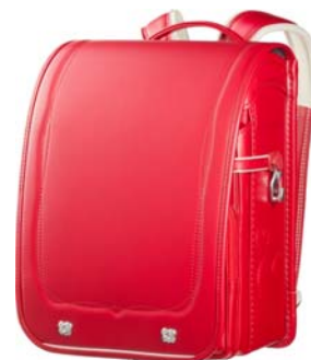
（ハートデザイン） ルージュレット