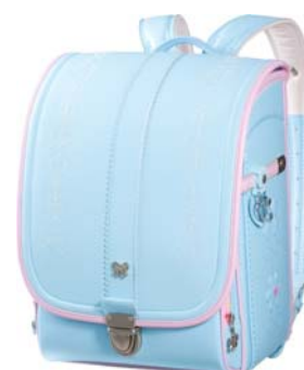
(ハート&りぼんデザイン) カラー：ソラ