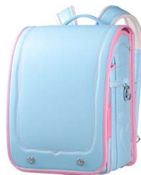
ハートデザインの一例