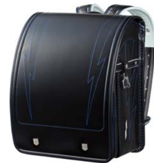
(エンブレムデザイン) ブラック×ブルーステッチ