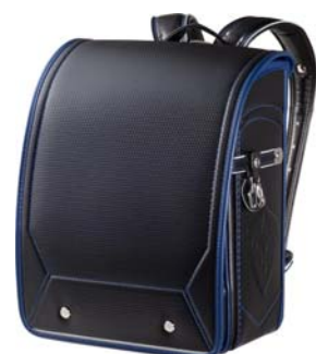
ブラック×マリンブルー×背裏ブラック