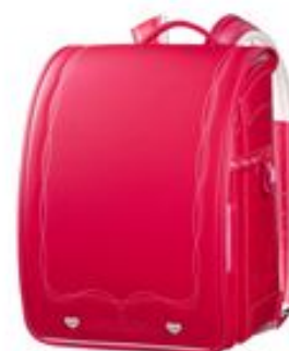
(ハートデザイン) カラー：ストロベリー