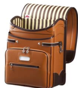
レトロクラシック