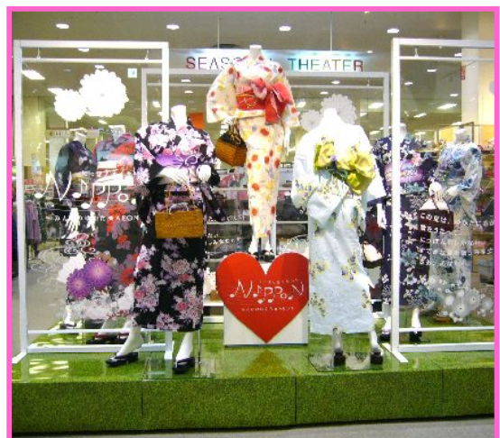
イオンのゆかた展開売場の一例