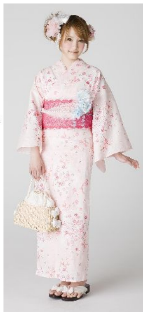
ピンク花柄の プリンセスゆかた