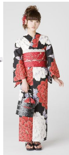
大輪花で華やか ビジンゆかた