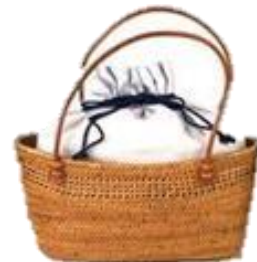
巾着 紋 アタ