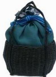
巾着 花 和柄