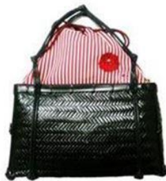
巾着 花 桜刺繍

◇籠バック：丁寧に編まれた籠が上質感を、中の巾着が着こなしのアクセントになります。また、洋服の時でも使えるデザインもあるので使い回しができて便利です。