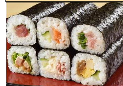
6種のバラエティー 中巻-halfセット