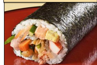
イオンの恵方巻【雅】

具材：ねぎとろ・えび・サーモン・かに蒲・かんぴょう・にんじん・ごぼう・菜の花・いなりあげ・桜えび・大葉・ねぎ・胡瓜・玉子 計14品